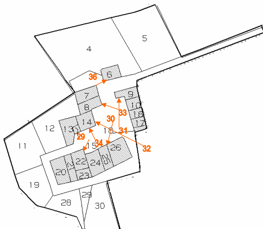
Punti di ripresa fotografica